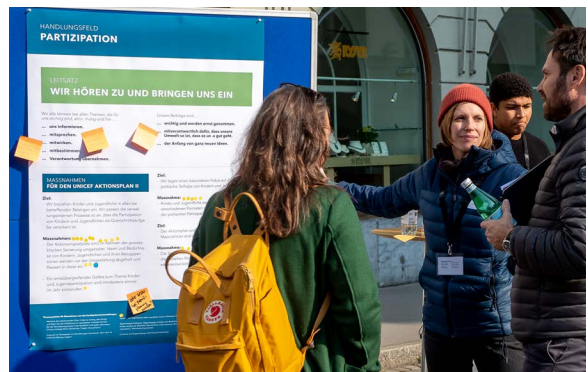
Kinder- und Jugendleitbild Thun