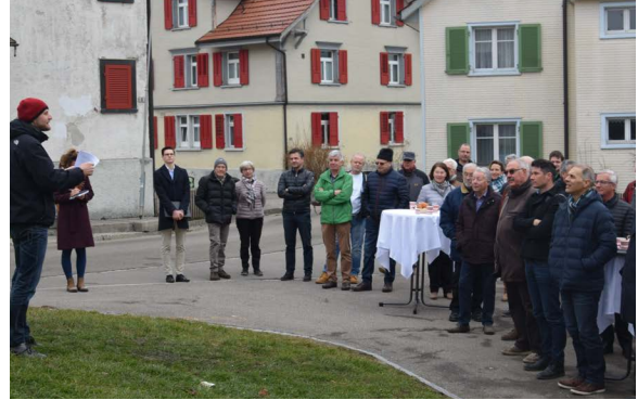
Dorfzentrum Mörschwil · Foto: ProjektForum