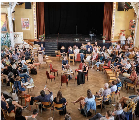
Moderation Fish-Bowl an Jubiläum DOJ