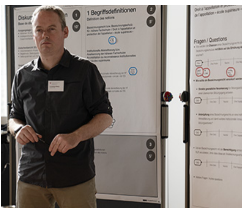
Moderation an den Arbeitstagen SBFI · Foto: klappe.ch

Für das Gesundheitsdepartement Kanton Basel-Stadt und das Departement Gesundheit der Berner Fachhochschule konzipierte ProjektForum die Veranstaltungsreihe mit dem Ziel mit partnerschaftlich-partizipativen Methoden eine ausgewogene Ernährung bei alleinlebenden Personen im Alter 65+ zu fördern. ProjektForum moderierte zwei hybride, Corona-konforme Workshops mit rund 20 Senior*innen in einem speziellen Kleingruppen-Setting.