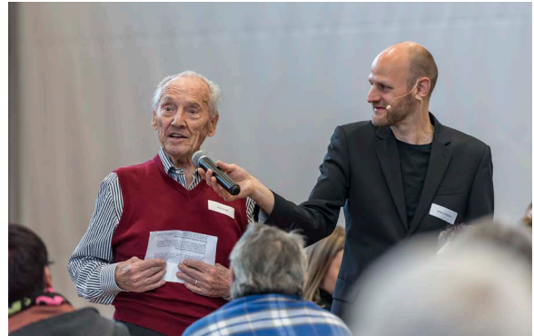
Zukunftskafi Muri