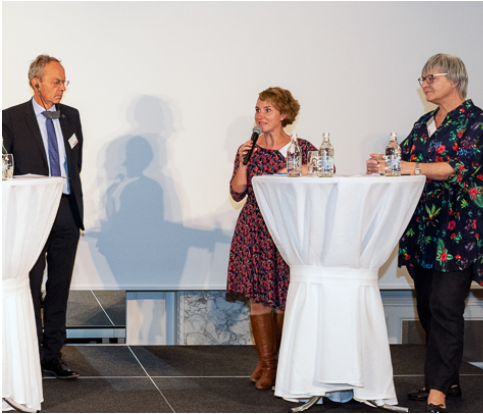
Podium am Bildungstag LCH/SER