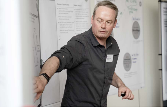
Arbeitstagenen SBFI