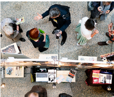
Vernetzungstreffen: Schweizer Künstlerbörse