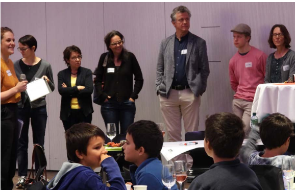
Zukunftskafi Windisch