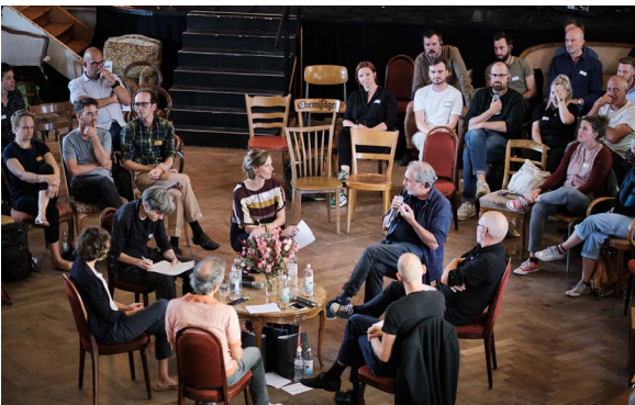
Jubiläum DOJ