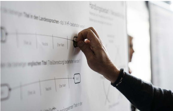
Arbeitstagenen SBFI