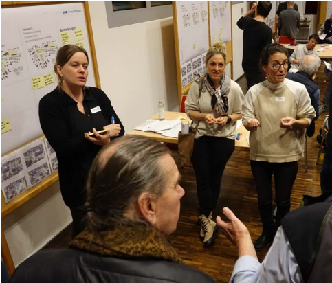
Moderation Zentrumsgestaltung Grabs